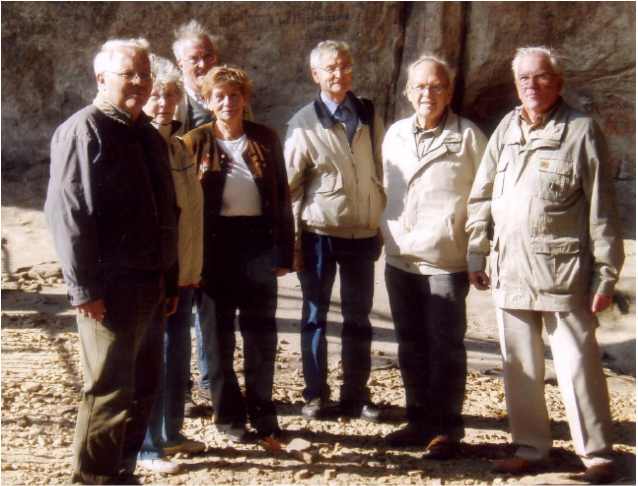
Nach dem Aufstieg am Kuhstall

Ein jedes Alter hat seine Reize, seinen Geist und seine Sitten.