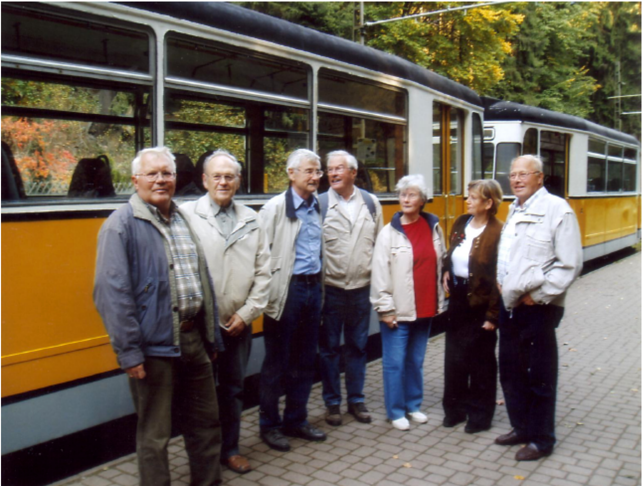
Am Stadtpark von Bad Schandau

Durch den Ausschuss Senioren des Landesverbandes wurden die Mitglieder im Ruhestand diesmal persönlich schriftlich eingeladen.