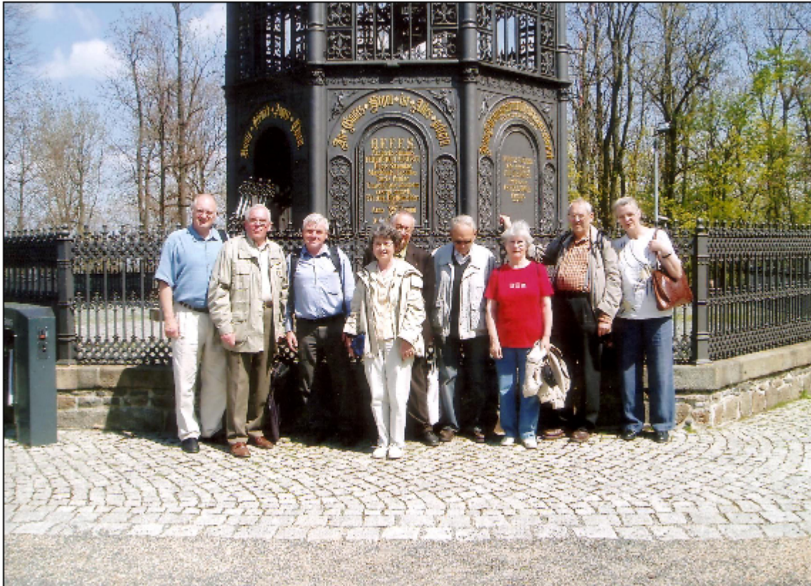
Am berühmten gusseisernen Löbauer Turm

Mit einem Kleinbus ging es dann zum Wahrzeichen Löbaus, dem 1854 erbauten „König – Friedrich – August – Turm“. Er ist der einzige gusseiserne Turm in Europa, der in spezieller Strecktechnik errichtet wurde.