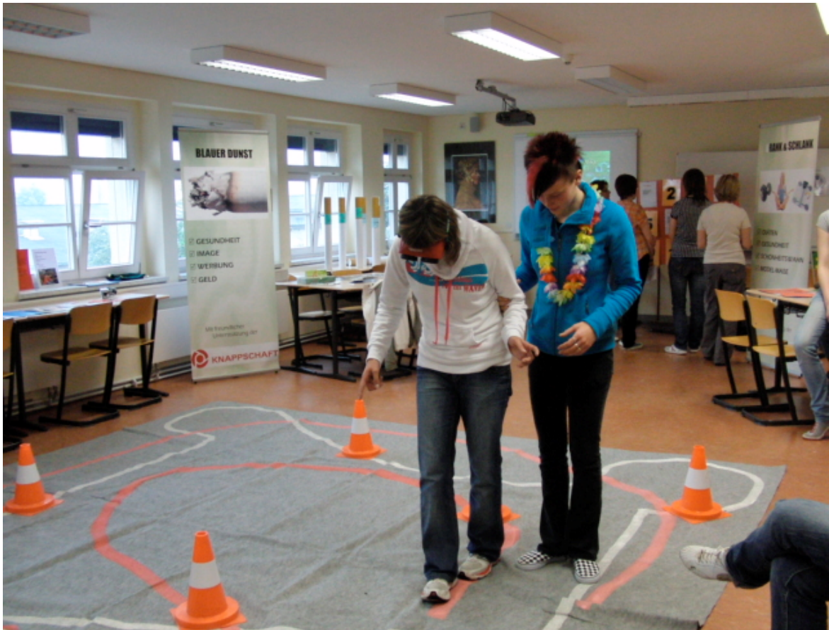
Mit einer Rauschbrille, die dem Träger einen Alkoholpegel von 0,8 oder 1,3 Promille suggeriert, musste man über eine Hindernisstrecke gehen.