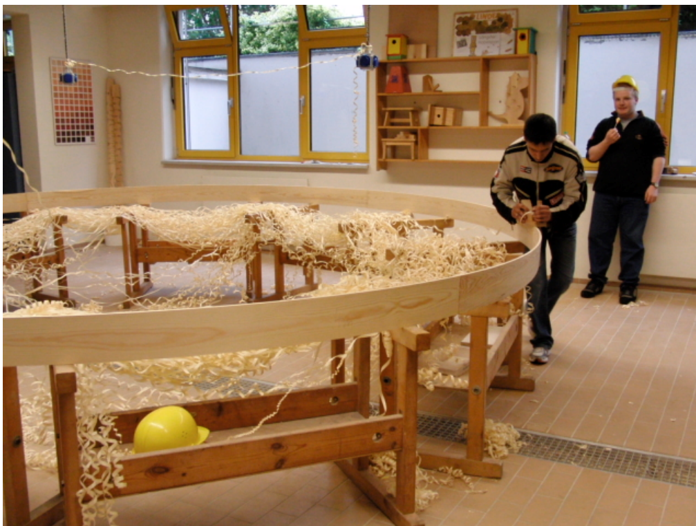
Der längste Hobelspan wurde 328,50 m lang.

J. Steinhoff sowie Jugendredaktion BSZ Kamenz