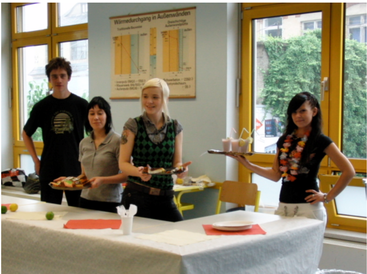
Wie im Paradies ging es am Beruflichen Schulzentrum Kamenz zu.

Den Abschluss bildete die Siegerehrung umrahmt von Gesangseinlagen der Schülerinnen der 11. Klasse. Ein rundum gelungenes Schulfest ging somit zu Ende und wir hoffen auf eine Wiederholung im nächsten Jahr, hoffentlich bei blauem Himmel.