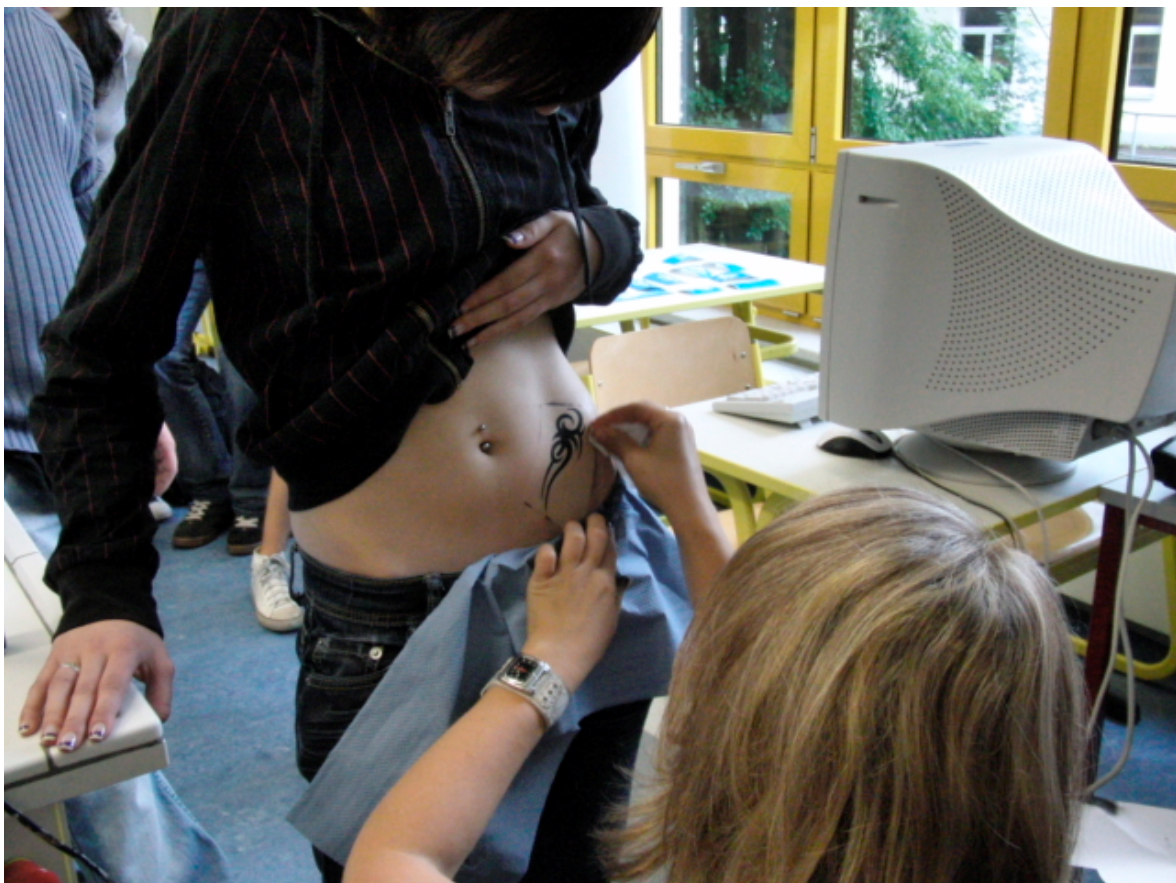
Besonders lang war die Schlange beim Airbrushtattoo.