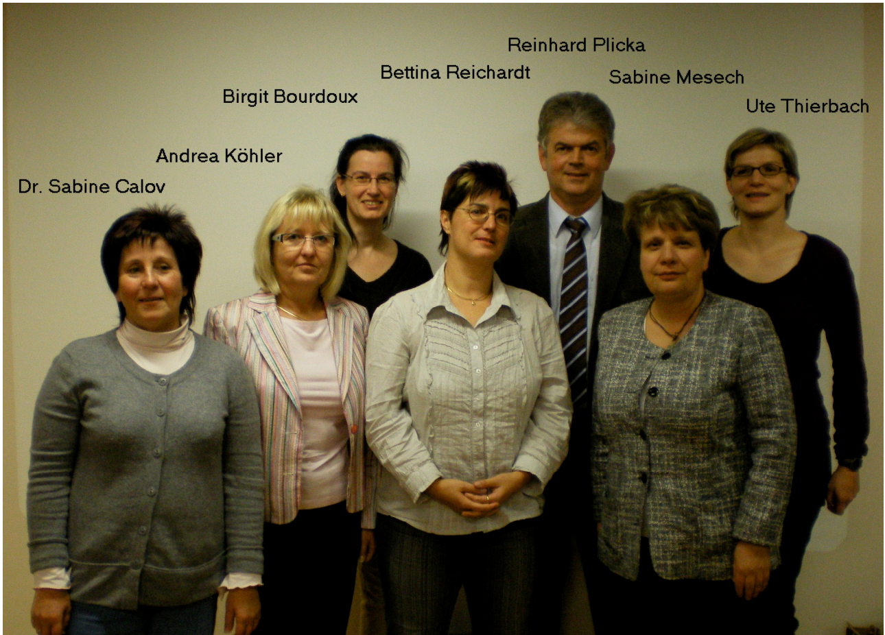
Der neu gewählte Landesvorstand