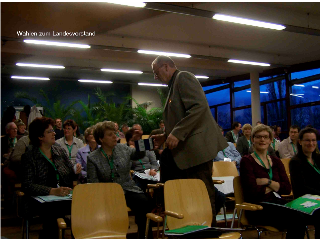
Wahlen zum Landesvorstand