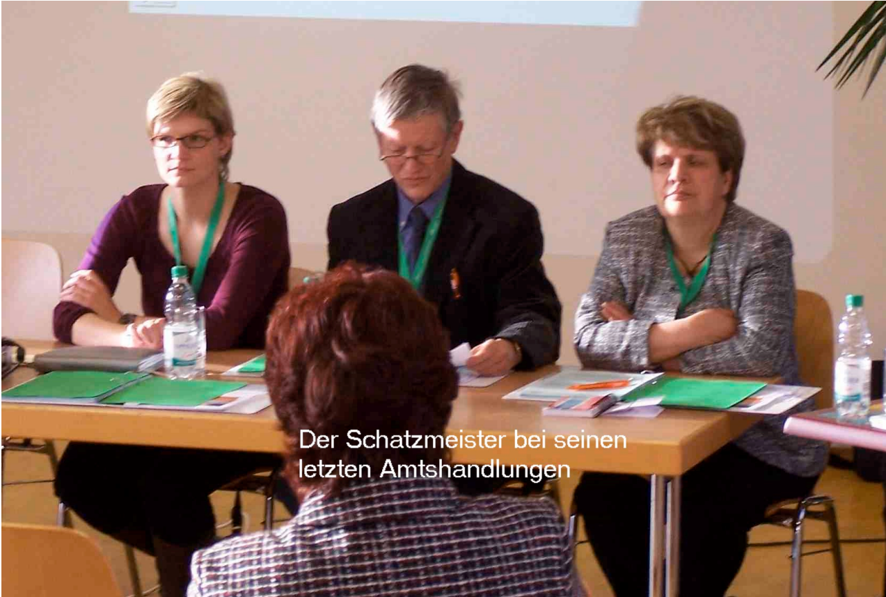
Der Schatzmeister bei seinen letzten Amtshandlungen