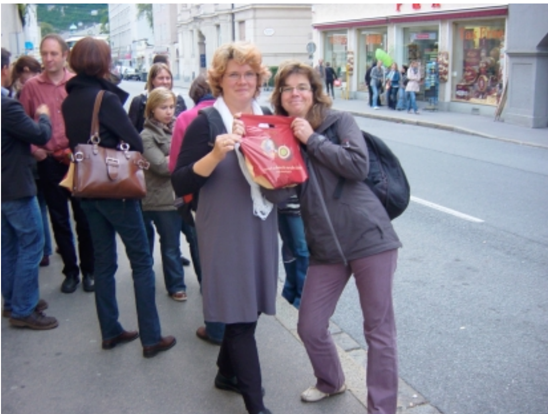
Tagungsteilnehmer mit Mozartkugeln beim Stadtrundgang