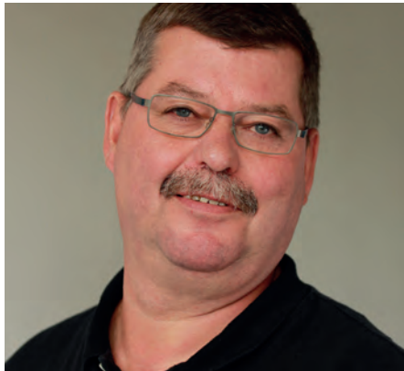
von Jürgen Fischer

Unter diesem Titel hat die TU Chemnitz, Professur Berufs- und Wirtschaftspädagogik zum 4. Brückenkolloquium eingeladen.