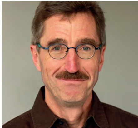
von Uwe Kirchschrager Vorsitzender des RV Leipzig

Am 23.04.2016, bei schönstem Aprilwetter, besuchten 80 Mitglieder des LVBS mit ihren Angehörigen die Darstellung des Great Barrier Reef nach Assisi Manier im Panometer Leipzig.