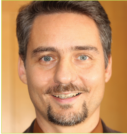
von Andreas Füll Ausschuss Senioren des LVBS

BESUCH DER SENIORENGRUPPE IN DER „DEUTSCHEN KUNSTBLUME“ IN SEBNITZ AM 7. JUNI 2017