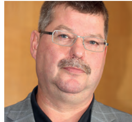
von Jürgen Fischer 2. Vorsitzender

Am 28.09.2016 lud der LVBS die ÖPR Vorsitzenden der Berufsschulen wieder einmal zum Stammtisch in die Gaststätte „Zum Schießhaus“ nach Dresden.