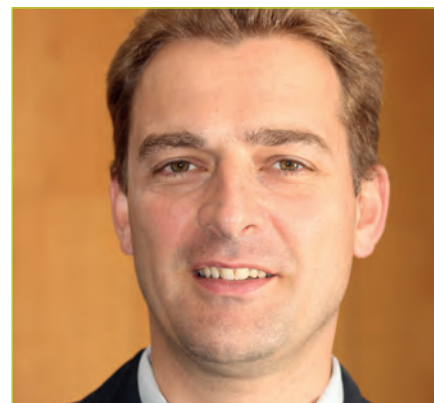
von Oliver Bergner

Rückwirkend zum 01.02.2017 plant das Sächsische Staatsministerium für Kultus die „Gewährung von Sonderzuschlägen“, um die Ausbildungsbedingungen für Lehramtsanwärter und Studienreferendare zu verbessern“. Diese Nachricht erreichte uns unter der Rubrik „Umsetzung des Maßnahmenpakets der Staatsregierung zur Lehrerversorgung“. Es handelt sich hier um jenes Maßnahmenpaket, dessen Erarbeitung nach mehr als 10 Verhandlungstagen mit den Gewerkschaften ergebnislos abgebrochen und welches anschließend als Heilsbringer einseitig von der Staatsregierung verkündet wurde.