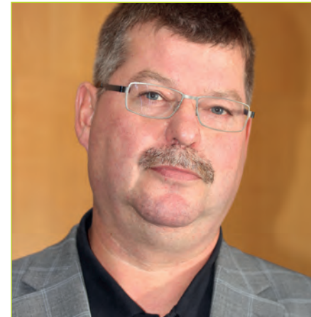
von Jürgen Fischer

Ein Thema, welches lange Zeit ein Tabu war, ist nun endlich aufgegriffen und zielführend bearbeitet worden.