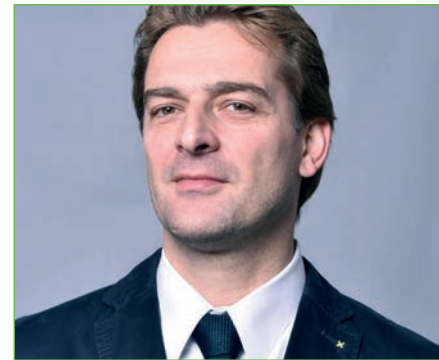
von Oliver Bergner

Der Mitte April durchgeführte Gewerkschaftstag unserer Dachorganisation stand unter dem Motto: „In Herausforderungen Chancen sehen. Wir machen Staat!“ Die Delegierten der 37 Mitgliedsgewerkschaften und Verbände wählten den neuen Vorstand für die nächsten 5 Jahre und stimmten über mehr als 90 Anträge ab, welche die gewerkschaftspolitische Ausrichtung des SBB für die kommenden Jahre bestimmen werden. Die vom LVBS eingebrachten Forderungen nach der Einrichtung von Unterstützungsgremien, insbesondere der Rentenberatung sowie Einrichtung einer ständigen AG Lehrerverbände im SBB wurden als Arbeitsmaterial angenommen. Das bedeutet, dass diese Themen bearbeitet, derzeit jedoch nicht