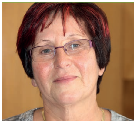
von Dr. Sabine Calov

Der 1908 gegründete Bundesverband der Lehrerinnen und Lehrer an Wirtschaftsschulen e.V. (VLW) und der 1949 gegründete Bundesverband der Lehrerinnen und Lehrer an beruflichen Schulen e.V. (BLBS) sind verschmolzen. Die BHV des VLW und die Delegiertenversammlung des BLBS haben am 11. April 2018 in Berlin einstimmig beschlossen, beide Verbände in den neuen, schlagkräftigen Bundesverband der Lehrkräfte für Berufsbildung (BvLB) zu überführen.