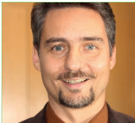
von Andreas Füll

Für alle, die sich für das Fliegen interessieren und gerne einen Blick hinter die Kulissen des größten mitteldeutschen Flughafens werfen wollen, sind beim nächsten Ausflug der LVBS-Seniorengruppe am 26. September 2018 genau richtig. Erleben Sie Abläufe bei der Passagierabfertigung, einen Einblick in die Arbeit der Flughafenfeuerwehr und der Frachtabfertigung auf dem Gelände der DHL. Höhepunkte sind die Fahrt mit dem Bus über eine der Start- und Landebahnen sowie die Besichtigung einer historischen IL-18 Maschine.