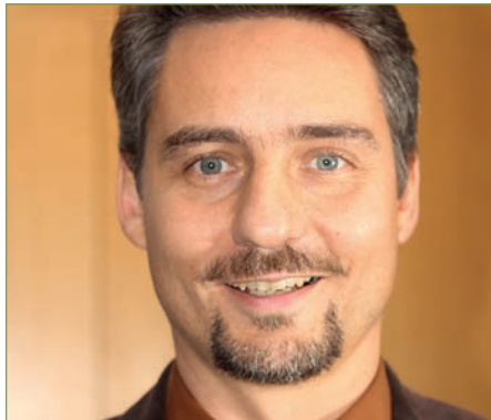
von Andreas Füll Ausschuss Senioren

Bei der 35. Veranstaltung der Seniorengruppe des LVBS drehte sich alles um die Geschichte der Industrialisierung Sachsens - vom 19. Jahrhundert bis heute.