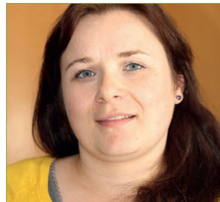
von Kathleen Dilg

Für die Zusammenführung der Pflegeberufe der Altenpflege, der Gesundheits- und Krankenpflege sowie der Kindergesundheits- und Krankenpflege zu einer generalistischen Ausbildung nach dem Pflegeberufegesetz (PflBG) zum 1. Januar 2020 wird eine neue Ausbildungs- und Prüfungsverordnung benötigt. Diese soll die notwendigen Rahmenbedingungen zur Umsetzung des PflBG schaffen. Im Juni 2018 hat das Bundeskabinett die gemeinsam von Bundesfamilien- und Bundesgesundheitsministerium vorgelegte Ausbildungs- und Prüfungsverordnung zum Pflegeberufegesetz (PflAPrV) zur Kenntnis genommen (vgl. BMFSFJ 2018).