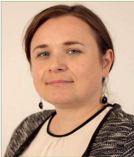
von Kathleen Dilg und Harald Bielitz

Am 11. Oktober 2022 trafen sich im Kongressraum des LVBS Sachsen in Dresden Schulleiter*innen und Lehrende der ATA- und OTA-Ausbildung in Sachsen. Gemeinschaftlich eingeladen zu dieser Fachtagung hatten der BLGS-LV Sachsen und der LVBS Sachsen. Ziel war es, Akteurinnen und Akteure, die an der Umsetzung der neuregelten