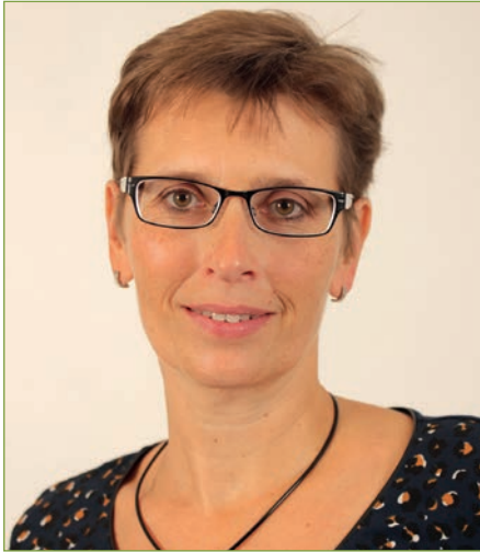
von Petra Dittmer

Nachhaltigkeit – das Modewort der Saison oder das dringend benötigte Umdenken in der ganzen Gesellschaft – auch in der beruflichen Bildung?