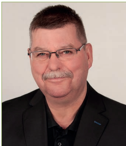
von Jürgen Fischer 2. Vorsitzender

Am 12.10.2022 führte der LVBS seinen traditionellen Stammtisch der ÖPR-Vorsitzenden in der Gaststätte "Zum Schießhaus" in Dresden durch.