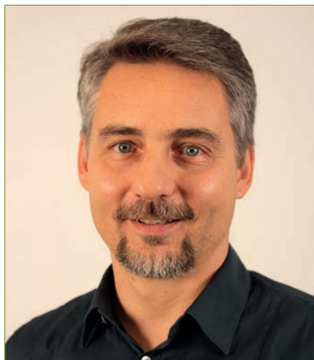
von Andreas Füll Ausschuss Senioren

Nach zweijähriger coronabedingter Zwangspause konnten wir endlich wieder einen Ausflug der LVBS-Seniorengruppe organisieren. Ziel war die die 9. Sächsische Landesgartenschau in Torgau.